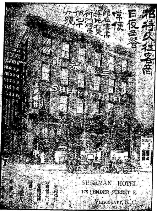
SHERMAN HOTEL 176 FENDER STREET E. Vancouver, B. C.