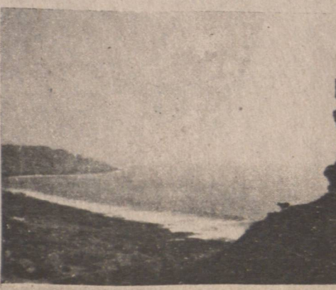
圖下：佳樂水沿岸的奇岩怪石。