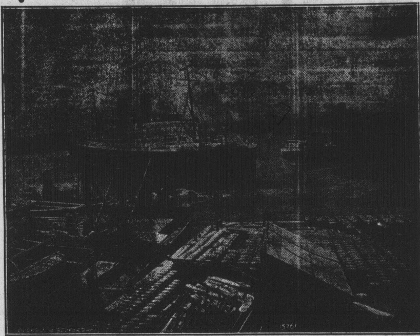
Remarquable photographie du "Duchess of Bedford" du Pacifique Canadien, prise récemment au moment où le gigantesque paquebot de 20,000 tonnes sortait du port de Montréal pour entreprendre la traversée de l'Atlantique. Ce navire est l'un des quatre du même tonnage que la Cie du Pacifique Canadien a mis en service l'été dernier. La présence de ces puissantes unités sur le fleuve Saint-Laurent démontre la popularité croissante de cette route auprès des touristes, en même temps qu'elle témoigne de l'apogée d'entreprene de la grande compagnie de transport canadienne.