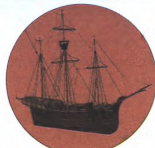
Modèle du Matthew

Quand Jean Cabot est arrivé sur les côtes du Canada atlantique il y a 500 ans, il se croyait en Asie. L'équipage de la réplique moderne du bateau de Cabot, « The Matthew », qui parcourt la région, pourrait être surpris de constater que la culture de l'Asie-Pacifique est florissante cet été sur la côte est du Canada. Des artistes, des organisations et des groupes ethnoculturels de partout dans la région de l'Atlantique ont donné vie au programme culturel de l'ACAP.