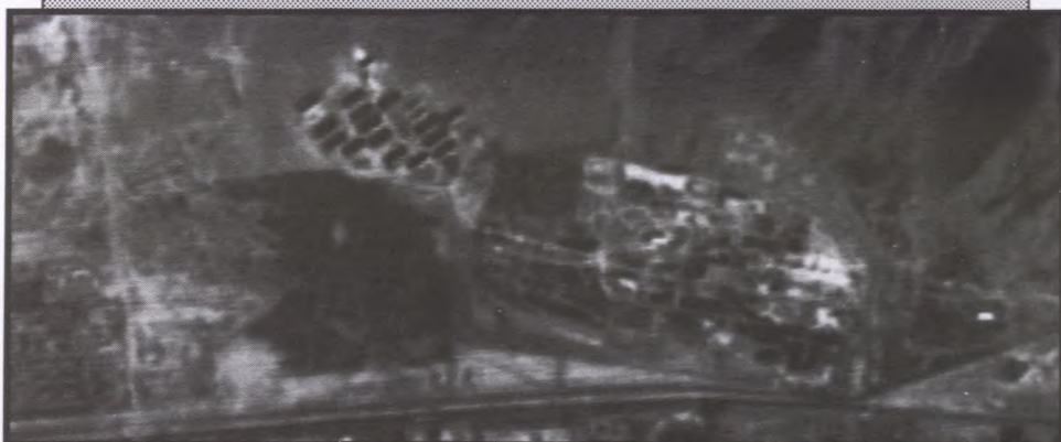
Image panchromatique prise en 1988