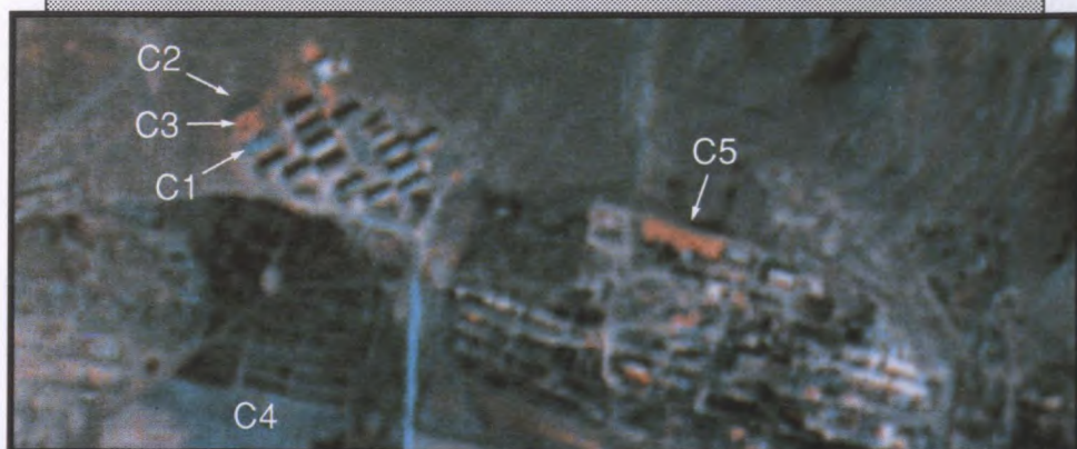
Superposition des deux images, permettant de détecter les changements