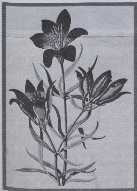
Le lys sauvage, symbole de la Province.