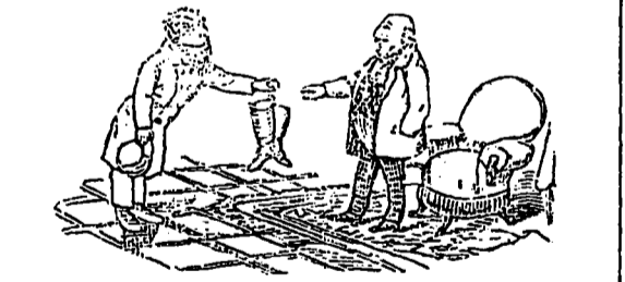
Paddy présente les bottes.