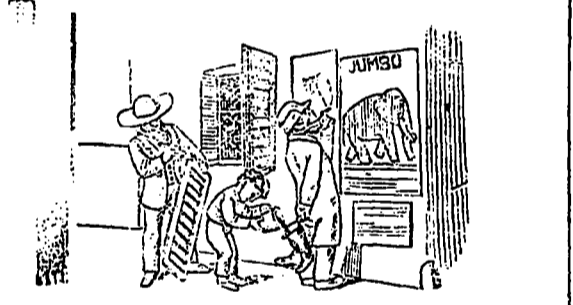
Paddy admire Jumbo et le gamin aperçoit les bottes