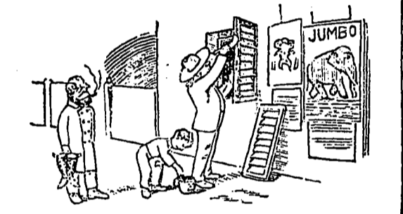
Paddy porte les bottes à M. O'Flaherty: