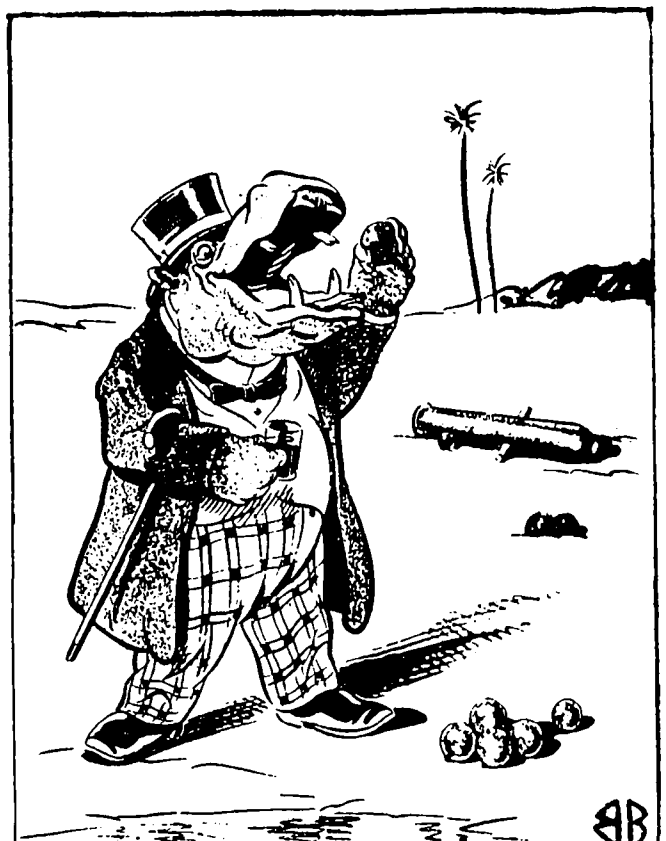
L'hyppopotame .—Quelle chance ! Le médecin qui m'a recommandé de prendre des pilules de fer...