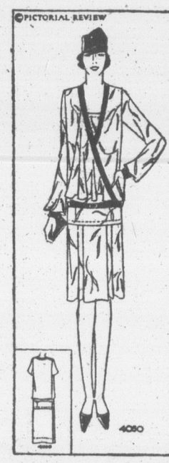
ÉLÉGANTE ET SOUPLE

Monogramme No 579. Monogramme de deux lettres perforées, de deux pouces de hauteur, 50 cents.