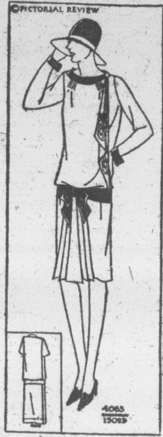
ROBE AVEC NOUVEAU COL

fournie par Mary Brooks Picken, Éditeur de la Chronique de Couture des Publications Excella- Patron Pictorial Review