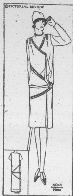
LA LIGNE DIAGONALE

Pictorial Review Printed Pattern No 4063. Grandeurs, 14 à 18 ans et 34 à 44 de buste, 45 cents. Transfer No 13023, bleu et jaune, 40 cents.