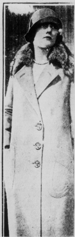
Modèle de manteau d'automne à coupe simple; trois boutons, collet de fourrure et à poches assorties sur le côté. C'est un manteau long sans ceinture.

Ci gît le corps d'une belle, Que la mort d'un mari réduisit au néant; C'est la seule mode nouvelle, Que les femmes ne suivront pas. Toute belle veut plaire; un grain de vanité, doit donc s'excuser chez elle. Une femme d'esprit, au lieu de s'affliger, De quereller, faire tapage, Vient toujours à bout d'arranger Les petits tracassés du ménage. Prend le premier conseil d'une femme et non le second, car la femme juge mieux d'instinct que de réflexion. Douceur et gaieté, voilà le fond d'un caractère aimable; il est impossible qu'une femme douée de ces deux qualités ne plaise. La douceur lui concilie tous les