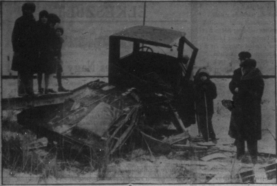
Képünkön látható automobilt Moose Jaw, Sask. közelében üttette el a vonat az egyik átjáróján múlt csütörtökön. A bennülők közül hárman meghaltak, viszont két kisgyerekek nem történt semmi baja.