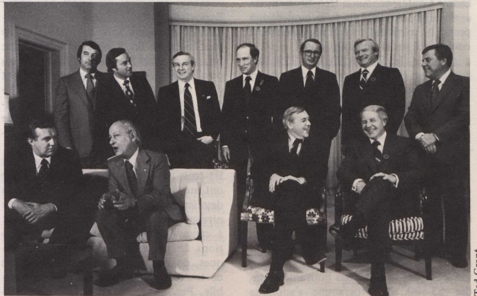
Les dix premiers ministres provinciaux, en compagnie du premier ministre, M. Pierre Trudeau (debout, quatrième en partant de la gauche), lors de la Conférence fédérale provinciale des premiers ministres qui s'est tenue à Ottawa du 30 octobre au 1er novembre: (debout dans l'ordre habituel) M. Bennett Campbell (Île-du-Prince-Édouard), M. William Bennett (Colombie-Britannique), M. Peter Lougheed (Alberta), M. Frank Moores (Terre-Neuve), M. William Davis (Ontario), M. Sterling Lyon (Manitoba); (assis dans l'ordre habituel) M. Richard Hatfield (Nouveau-Brunswick), M. René Lévesque (Québec), M. Allan Blakeney (Saskatchewan) et M. John Buchanan (Nouvelle-Écosse).