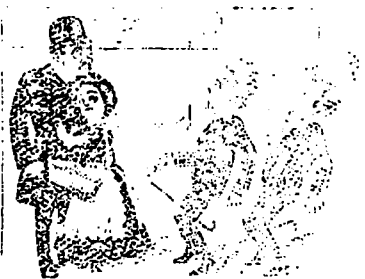
IV Le cousin de la fillette. — Eh bien ! Qu'avez-vous donc avec ces louches ouvertes ?