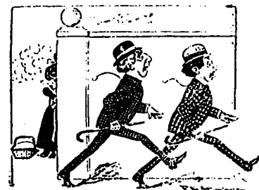
V ! — ! — ! — !

Tel. Bell Main 2367 Tel. des Marchands, 833