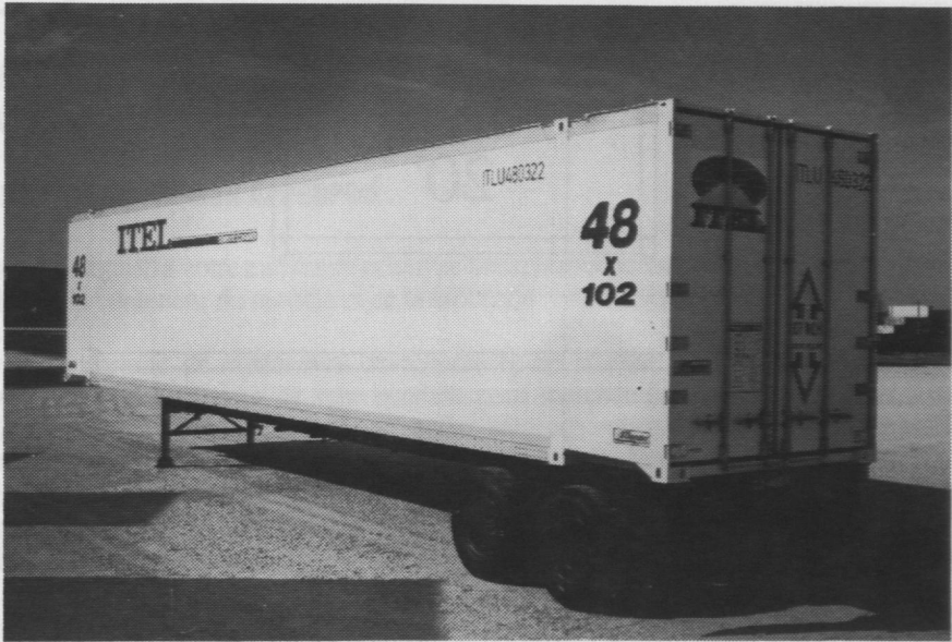
Conteneur de 48 pi pour le transport intérieur.