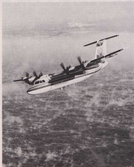
La De Havilland ha vendido o contratado más de 100 aparatos DASH-7 .

La De Havilland Aircraft anunció un aumento en las opciones para su nuevo avión DASH-8 de 36 pasajeros de 103 a 115 durante la inauguración del Salón Aeronáutico de París. Entre los clientes nuevos del DASH-8 se encontraba la Jersey European Airways, Aviation Enterprises y un operador norteamericano que permanece anónimo, mientras que la