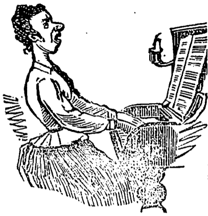
Dites-lui que je l'ai aimé!

Pendant les fiançailles: On choisit les meubles chez Penon: la psyché des plus coquettes et très-fine a été fort admirée. On arrive devant un lit. — Oh! déclare ingénument la jeune femme, je voudrais quelque chose d'élégant, mais de solide. Sourire discret du fiancé. — Parce que, ajoute-t-elle bien vite en rougissant, j'ai le sommeil très lourd!