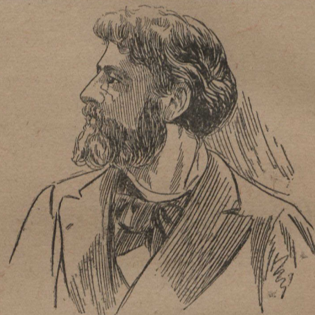
M. MOUNET-SULLY, célèbre tragédien français, auquel un fauteuil a été refusé à l'Institut; fauteuil qu'occupe maintenant M. Edmond de Rothschild.