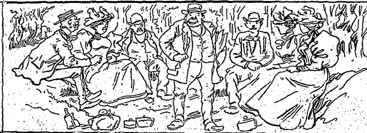
—Pique-nique! Chacun a apporté son plat !... —Et vous, monsieur Chayradin, qu'avez-vous apporté ? —Moi... les vieux journaux grasseux qu'on laisse sur l'herbe après déjeuner !...