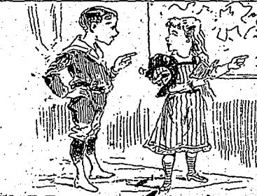
—Peux pas arriver à trouver Moscou sur la carte... —Naturellement; puisqu'il a été brûlé...