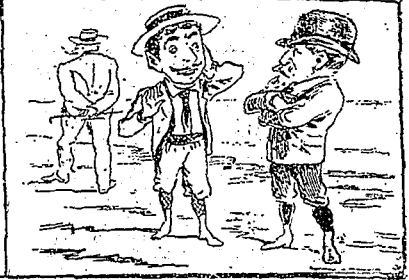
—Il vous a gâté, et vous ne dites rien ? —Ça ne compte pas, je suis lui sous un pseudonyme...