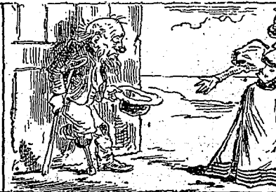
—Toi qui es riche, père, donne-lui donc deux sous ! —Ce serait contre mes principes religieux : " Ne faites pas à autrui ce que vous ne voudriez pas qu'on vous fit ! " Or, je ne tiens nullement à ce qu'on me fasse l'aumône !