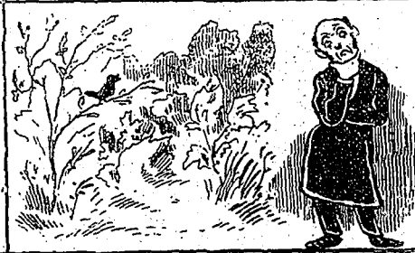
—Etrange!... A la campagne, j'entends le merle siffler dans un bocage! et à la ville, j'entends le merle siffler dans une belle cage!