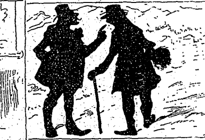
—C'est vraiment une région chloïse... —Oui, et si j'avais un bon conseil à vous donner, ça serait de vous faire enterrer ici.