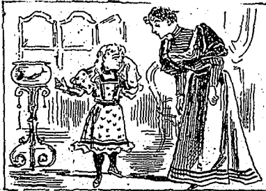
—Pourquoi ces pleurs ? —C'est p'pa qui veut supprimer mes poissons rouges parce que ça lui rappelle ses adversaires politiques.