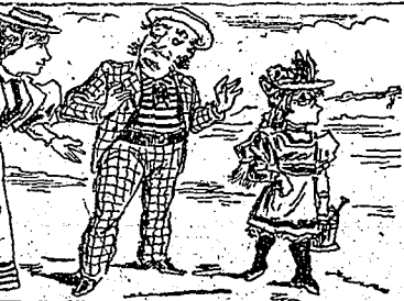
—Quoi qu'elle a la femme... elle est triste ! —J'en suis point... j'ai beau lui ficher des claques toute la journée, elle ne veut point rigoler.