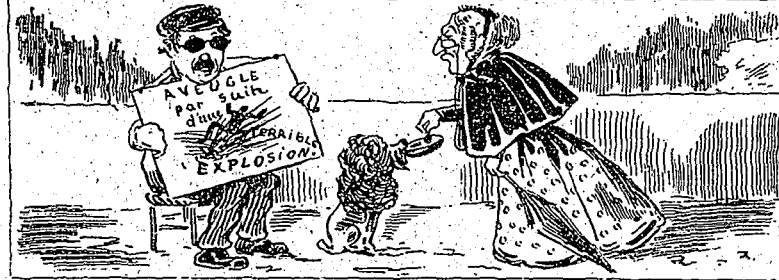
—Pauvre homme!... Y a-t-il longtemps que cette catastrophe est arrivée ? —Est-ce que j'sais, moi ! J'ai eu ça dans un lot à un encreu !...