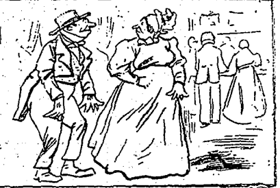
—C'est vraiment une région chloïse... —Oui, et si j'avais un bon conseil à vous donner, ça serait de vous faire enterrer ici.