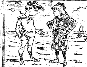
—Si tu voyais notre villa, Toto, elle est toute couverte de fleurs !... —Pseuh! qu'est-ce que c'est que ça à côté du château de papa, qui est tout couvert... d'hypothèques!...