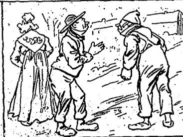
—Mais arrivez donc... il y a un crâne dîner de nocé et on n'attend que vous... —Voilà!... voilà! j'étais en train de m'aligner les dents...