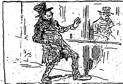
—Ça me dégoûte de voir un pechard... c'est tout de même curieux comme celui-là me ressemble!