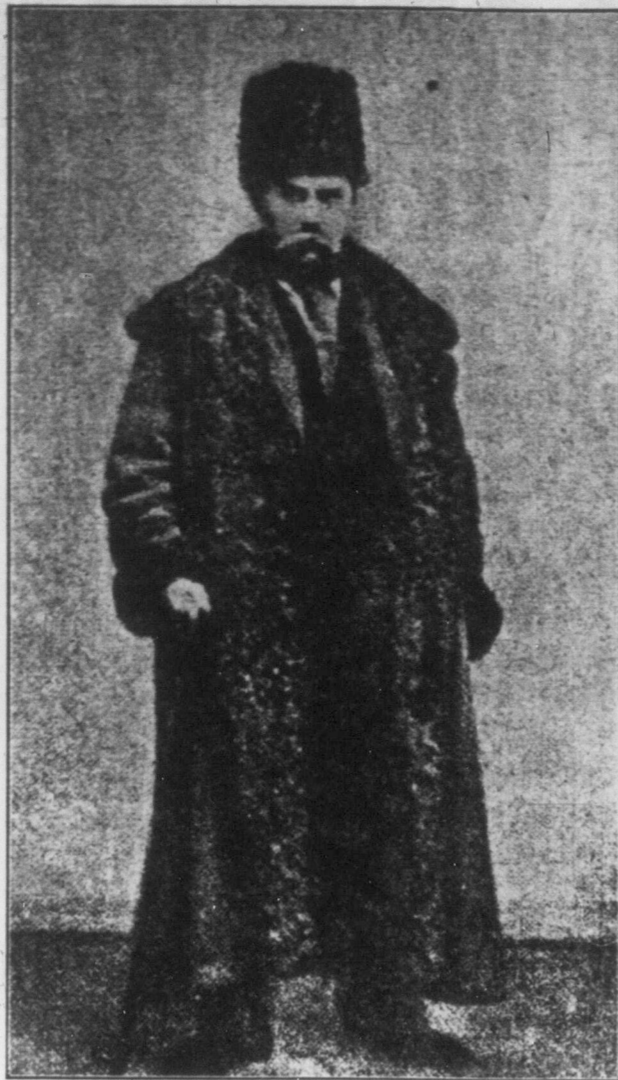
ТАРАС Г. ШЕВЧЕНКО (маловідома фотографія).