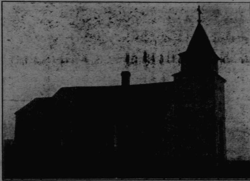
Kirche zu Enzelseld, gebaut 1905.

Ein ausgedehnter Gerichtsbezirk ist der des Richters Noel von Athabaska, welcher letzterer soeben eine große Kundreise durch das umfangreiche Gebiet angetreten hat, um an verschiedenen Punkten desselben Gerichtssitzungen abzuhalten. Er wird nicht vor Eintritt des