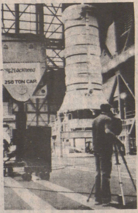
八月升空 一名攝影師把鏡頭對準太空穿梭機「發現號」的左方固體燃料推動火箭，「發現號」準備今年八月升空，這將是「挑戰者號」大災難以來首次飛行。