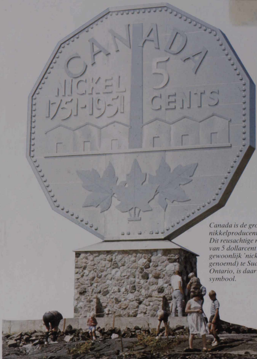
Canada is de grootste nikkelproducent ter wereld. Dit reusachtige muntstuk van 5 dollarcent (dat gewoonlijk 'nickel' wordt genoemd) te Sudbury, Ontario, is daarvan het symbool.

Het geeft ons veel voldoening te weten dat "Canada Vandaag" met belangstelling wordt gelezen.