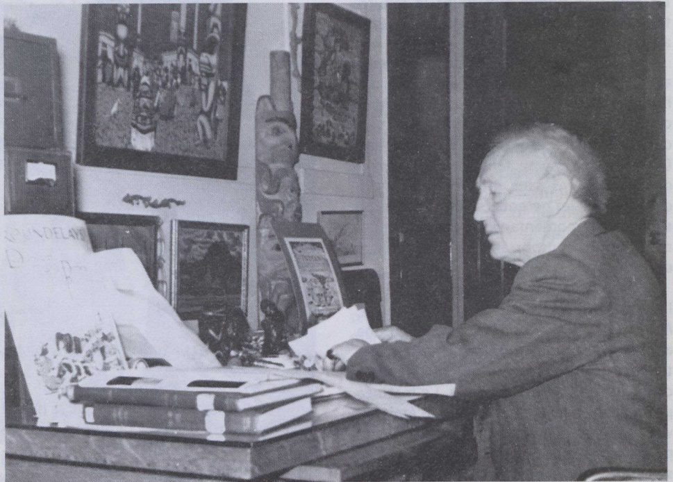
Marius Barbeau, collectionneur invétéré. (Source: Centre canadien d'études sur la culture traditionnelle, Musée national de l'homme, Musées nationaux du Canada 82-9113).

L'exposition retrace les influences formatrices du jeune Barbeau et relate à l'aide de photos, de manuscrits et d'objets collectionnés par Marius Barbeau lui-même, les différentes sphères de recherche et les nombreux domaines dans