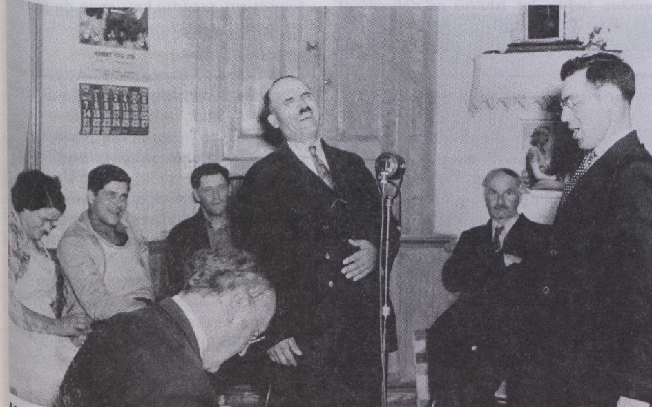
Marius Barbeau enregistrant des chansons traditionnelles canadiennes-françaises, 1941.