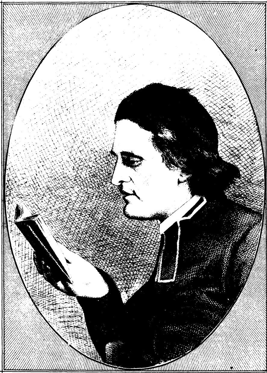
L'ABBÉ ÉPIPHANE LAPOINTE

Il y avait du souffle, de l'inspiration dans sa figure, aussi bien que dans son esprit. Ses traits énergiquement accentués, son œil de feu, son nez finement taillé, sa bouche délicate, son menton proéminent