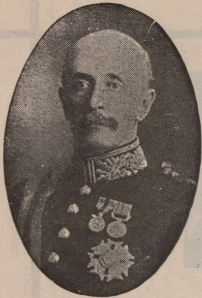
LORD GREY:— L'Angleterre nous le retourne pour lui permettre d'aider Laurier à finir son œuvre.