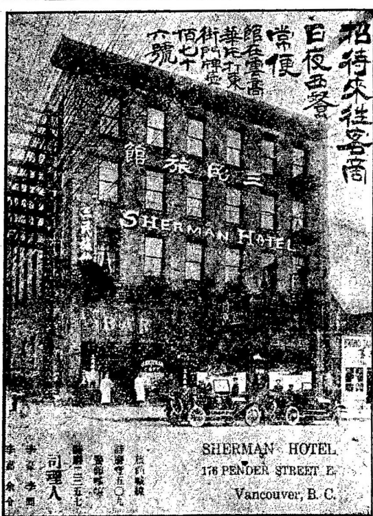
SHERMAN HOTEL 176 PENDER STREET E. Vancouver, B. C.