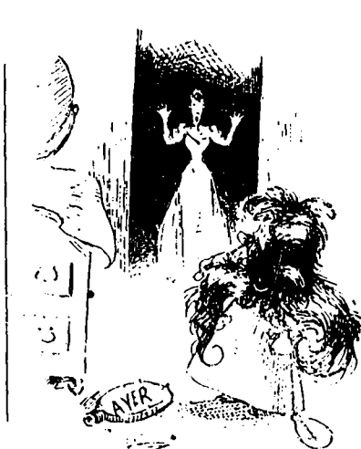
III ... quand la maman revint, elle eut tout lieu d'être agréablement surprise en voyant que Freddy pourrait faire concurrence à l'Homme-chien.

faim. Après s'être demandé s'il n'ouvrirait pas au Quartier Latin un cabaret pour y dire ses poèmes, il s'avise à temps que ce serait pas trop "à l'instar de Montmartre".