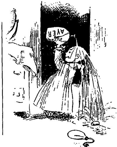
II Profitant d'un moment où il était seul, il s'empara du récipient et, pour ne pas rater son effet, il s'en arrosa copieusement le crâne ; aussi...