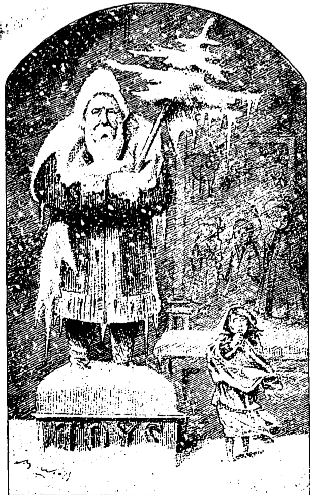
— Bon Santa-Claus, n'oubliez pas les petits enfants pauvres ?