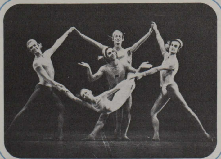
Parte del grupo del Grands Ballets Canadiens