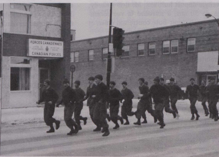
Quelques-uns des participants à l'exercice Berger-Perron de 1979. Même pendant les jours de repos les paras se tiennent en forme.