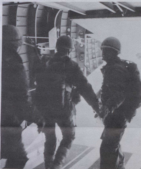
Les paras à l'oeuvre.

A la fin des hostilités, ces unités furent