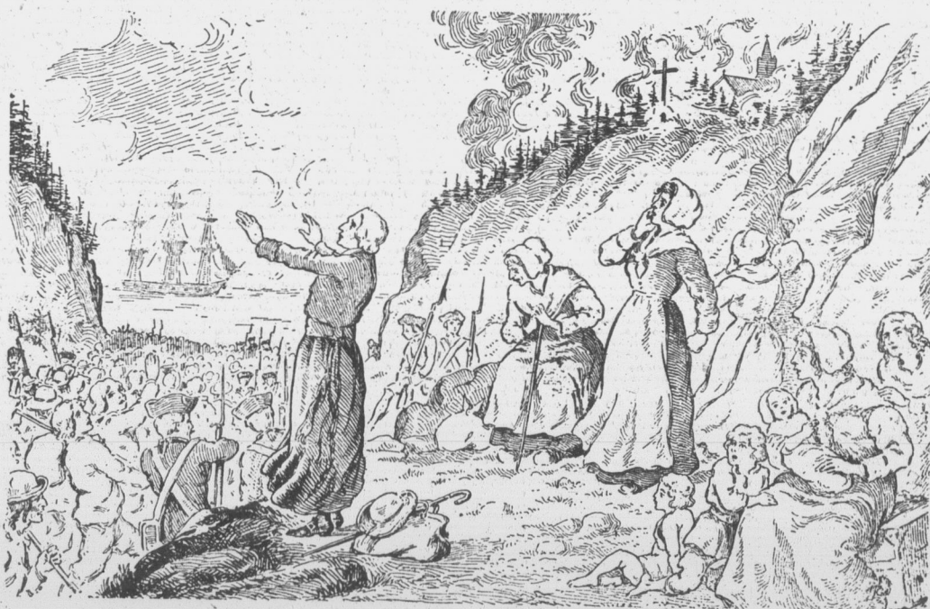
AU PAY D'EVANGELINE. — Le Grand Pré. — Le grand dérangement de 1755 — Dessin représentant l'embarquement des Acadiens de Grand-Pré à bord des navires anglais ancrés dans le Bassin des Mines, à l'entrée de la rivière Gaspereau. Au cours de la célébration du 23 août, à Grand Pré, les Acadiens ont pris officiellement possession d'une partie du terrain sur lequel s'est opéré l'embarquement de leurs ancêtres.