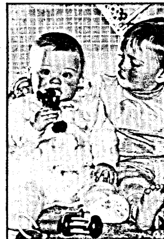
Enfants avec jouets de plastique.

d'identification des enfants à Toronto. Plus de 180 volontaires ont ainsi roulé de petites mains et de petits pieds dans l'encre noire afin d'en prendre les empreintes et de permettre ainsi à la police d'identifier les enfants en cas de disparition ou d'enlèvement. Tous les renseignements ont été inscrits sur des cartes qui ont été remises aux parents pour utilisation en cas de besoin. Les efforts antérieurs dans ce domaine avaient échoué, tout cela parce que les parents répugnaient à l'idée de voir leurs enfants "fichés" par le gouvernement ou la police.