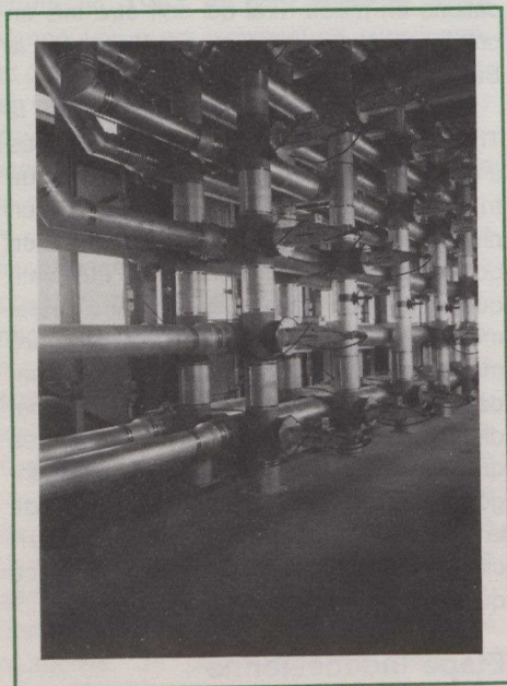
Grille matricielle reliant les diverses antennes aux huit émetteurs de la station émettrice de Sackville (Nouveau-Brunswick).

RCI diffuse également des émissions hebdomadaires sur des événements ou des problèmes particuliers. Celles-ci sont enregistrées sur bande ou par satellite à certaines stations radiophoniques situées en divers points du globe, notamment à Hong-Kong, à Tokyo, à Washington, à Mexico, à Caracas et dans d'autres centres importants.