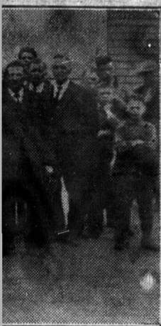
ace bovine canadienne

ADMINISTRATION ET PUBLICITE Abonnement payable d'avance.