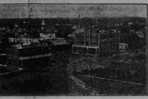
Ett af västerns blomstrande samhällen, där våra landsmän också äro representerade.

ALBERTA. Stora försäljningar af skolland. De största skollandsauktioner i västra Canadas historia skola hållas i Medicine Hat den sista maj. Auktionerna komma att grundligt annonseras både i Canada och Forenta Staterna, och tusentals landsökare väntas infinna sig.