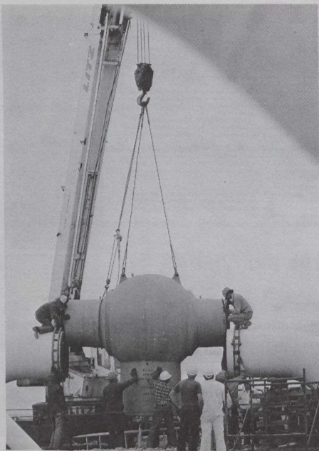
La société IPEL, filiale de TransCanada Pipeline, offre des programmes de gestion, de contrôle de la qualité et de formation.

qui fournit de nombreux services consultatifs aux distributeurs internationaux de gaz naturel et de pétrole. Congas entreprend des études détaillées (concernant, entre autres, la mise en marché, les prévisions de résultats, les tarifs, ainsi que la gestion et l'entretien des services publics) pour le compte des industries gazière et pétrolière, et des gouvernements. Les services qu'elle offre comprennent aussi la conception de systèmes de distribution, la surveillance de la construction des pipelines et l'élaboration de manuels de pratiques normalisées. Afin que ses clients acquièrent une formation et de l'expérience, elle leur donne une formation soit à son siège social canadien, soit dans leurs propres bureaux. Congas a