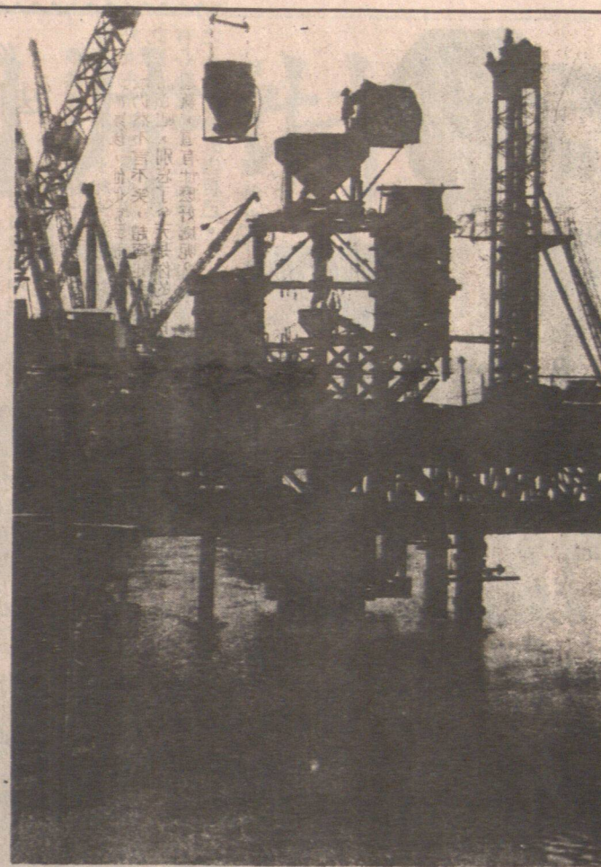
先期圖到連已，藝工格注灌孔鑽的用採工施墩橋橋大▲。 。平水連