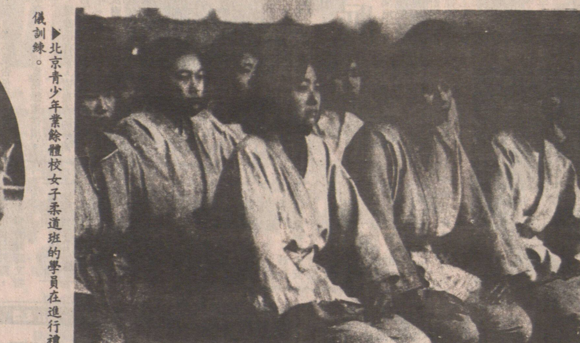
▲北京青少年體育學校女子柔道班的學員在進行 訓練。