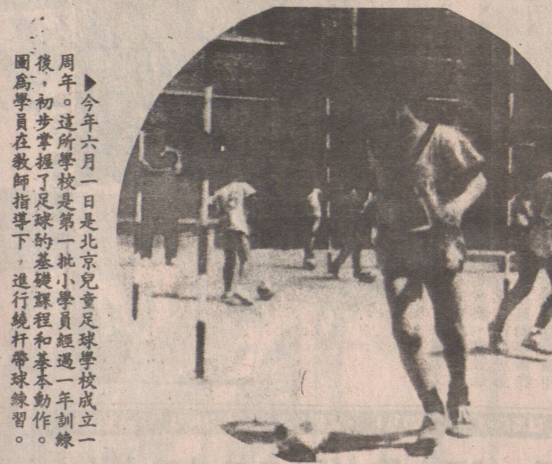
▲今年六月一日是北京兒童足球學校成立一 周年。這所學校是第一批小學員經過一年訓練 後，初步掌握了足球的基礎知識和技術動作。 圖為學員在教師指導下，進行球帶球練習。