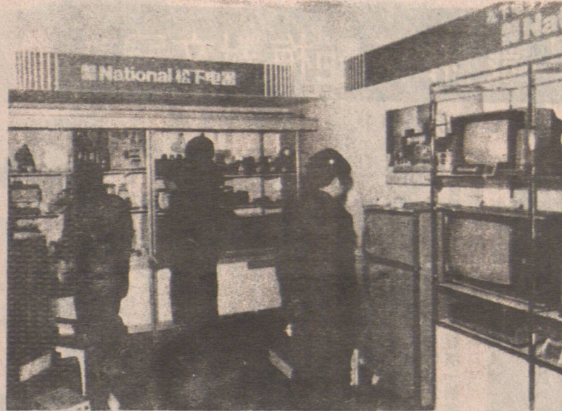
▲北京中僑總公司華僑外匯兌換商店三月在北 京東交民巷開業，這將大大方便回國探親、旅遊 的海外同胞，免其長途運輸贈送禮品的麻煩。圖 為顧客在選購商品。