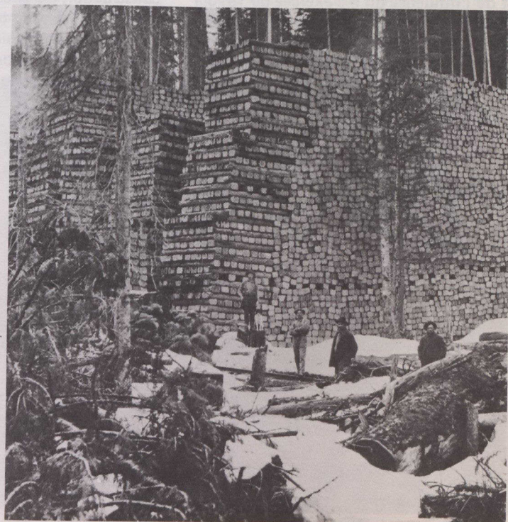
On a tiré deux millions de traverses des pins de Murray (C.-B.).