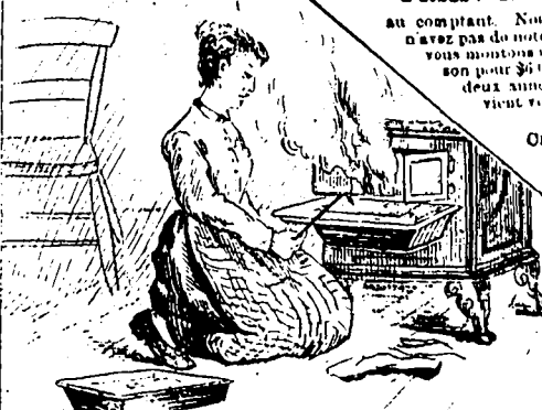
A MORISE TJE 1907.

Régistré New-York Life, Place d'Armes, MONTREAL