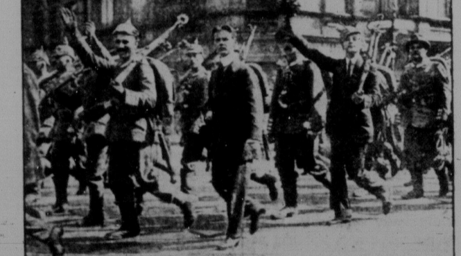
Задурені соціал-патріотами німецькі робітники 1914 року шили з ентузіазмом на фронт бити "ворога". (Фотографія була вміщена у всіх патріотичних газетах.)

трати війни: усі розходи на зброєння — це другий додаток, що його визначили імперіалісти на майно працюючих. І так кожну війну оплачує й оплачуватиме пролетаріат не тільки своєю кровю але й усім своїм майном і працею. От і зараз Німеччина сплачуватиме так звані репараційні довги, щобмо ма покрити до певної міри воєнні витрати Англії, Франції, Бельгії, Італії через 37 років по 525 мільйонів доларів річно, що робить разом 19 мільярдів 425 мільйонів доларів. Всю цю суму мусить сплачувати німецький пролетаріат через 37 років. Ці гроші йдуть в кишені закордонним