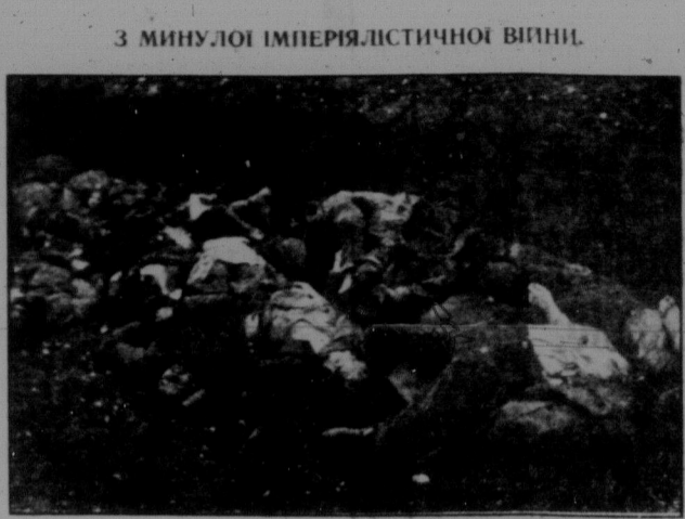
Після двох тижнів отак ті самі жовніри віддали життя на "полю слави" за панські інтереси. (Фотографія не була вміщена в одній патріотичній газеті.)

ни проти тієї однієї країни, де завдяки виграній пролетарської революції немає місця фашизму, проти Радянського Союзу. Щоб зломити опір працюючих проти імперіалістичної війни й щоб пролетаріат кинути знову на гарматне мисо у новій наступаючій війні, пануюча класа готується до громадянської війни, змінює реакцію, зброєю фашистські воєнні сили. Імперіалістична війна на землі є громадянська війна у внутрішній країні проти "внутрішнього ворога", щоб проти власного працюючого людю вже веде пануюча класа, що не в кожній імперіалістичній країні під виглядом білого терору. Врешті заклик Інтернаціонального Антифашистського Комітету кінчається: "Фашизм і війна є смертними ворогами працюючого людю! Геть з фашизмом і реакцією! Об'єднайте всі сили до боротьби проти небезпеки війни! Візьміть масову участь у інтернаціональному дні 1. серпня!" Інтернаціональний Антифашистський Комітет. Анрі Барбюс.