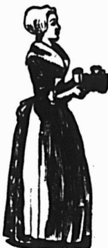
Registered U.S. Pat. Off.