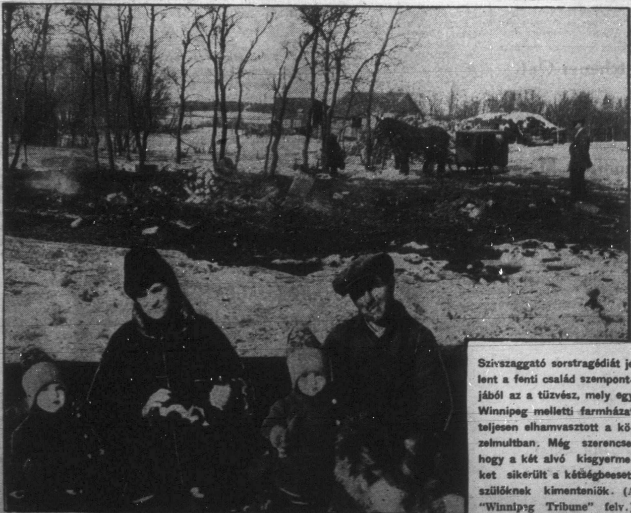
Szívszaggató sorstragédiát jelelt a fenti család szempontjából az a tűzvész, mely egy Winnipeg melletti farmházat teljesen elhamvasztott a közelmúltban. Még szerencse, hogy a két alvó kisgyermeket sikerült a kőtűzbeesett szülőknél kimenteniök.

Az ország legnagyobb gabonatermelő tartományja, a mult esztendő rossz termésel miatt pénzügyi zavarokkal küzdő Saskatchewan négymillió dolláros kölcsönre dobott piacra kötvényeket hat és fél százalékos kamattal. A montreali és torontói bankvilágban hihetetlen érdeklődés nyilatkozott meg a tartomány kölcsöne ügyében s bár akadtak olyanok, akik sőtén látták Nyugatkanada anyagi helyzetét, mindenképp több bizalmat árult el Keletkanada részéről az a tény, hogy a kölcsön kibocsátásának első napján máris tuljegyezték a kért négymillió dollárt.