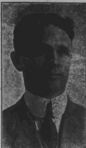
HON. JOHN BRACKEN, Manitobas premiärminister.

Trontolet, som å ämbetets vägnar framfördes av viceguvernören, Sir James Aikins, var ganska innehållsrik.