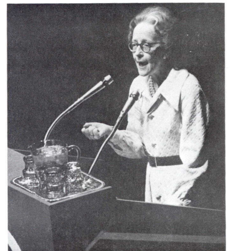
Madame Barbara Ward, économiste, s'adresse aux délégués après la séance plénière de la conférence au Queen Elizabeth Theater.

La grande dame du Forum, tout comme d'Habitat, a été incontestablement