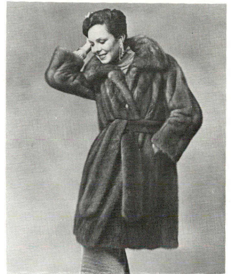
Un manteau de natural royal samink dessiné par I. Wasserman Incorporée, pour la Furmillion Corporation du Manitoba.

Cette année, la production atteindra 15,000 peaux, soit environ dix fois la production initiale.