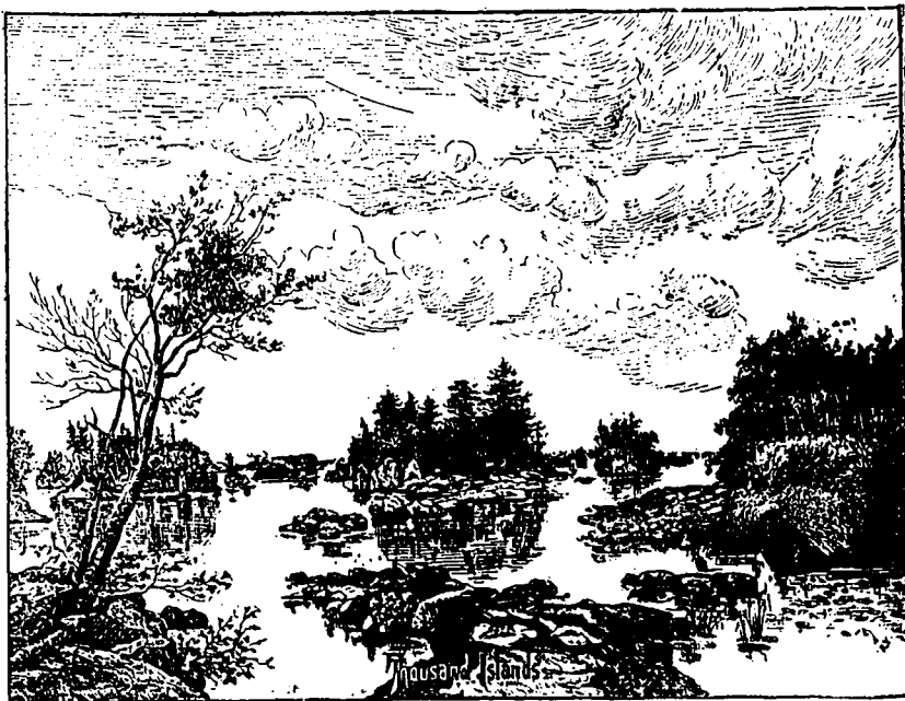
UN PAYSAGE DES MILLE ILES.