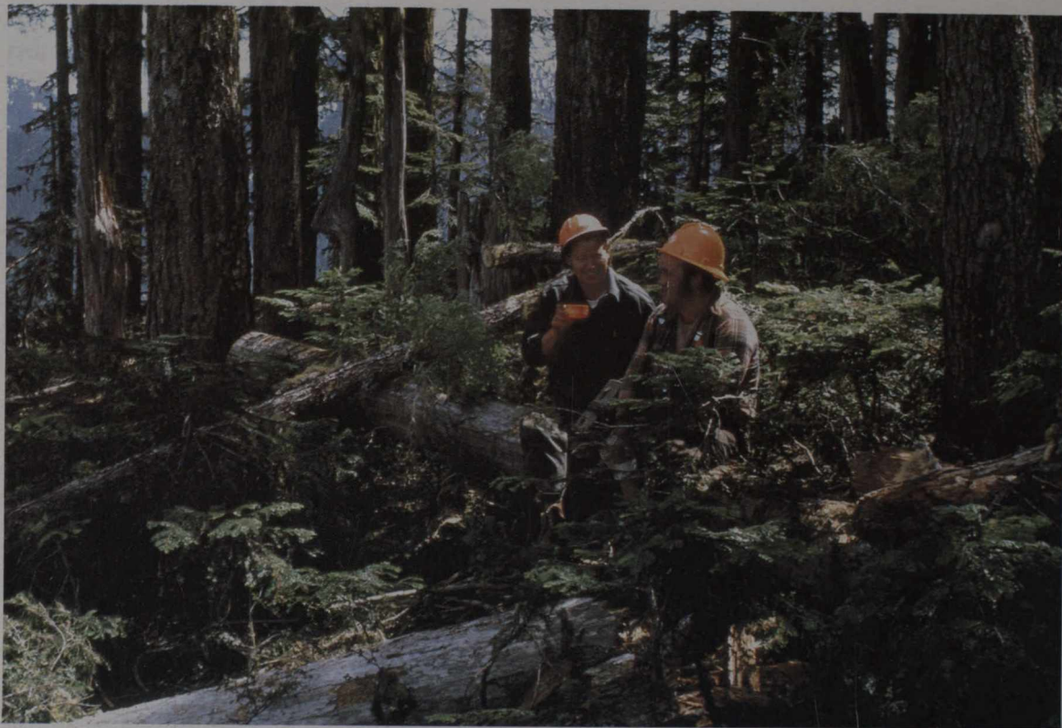
Unos taladores en su periodo de descanso.