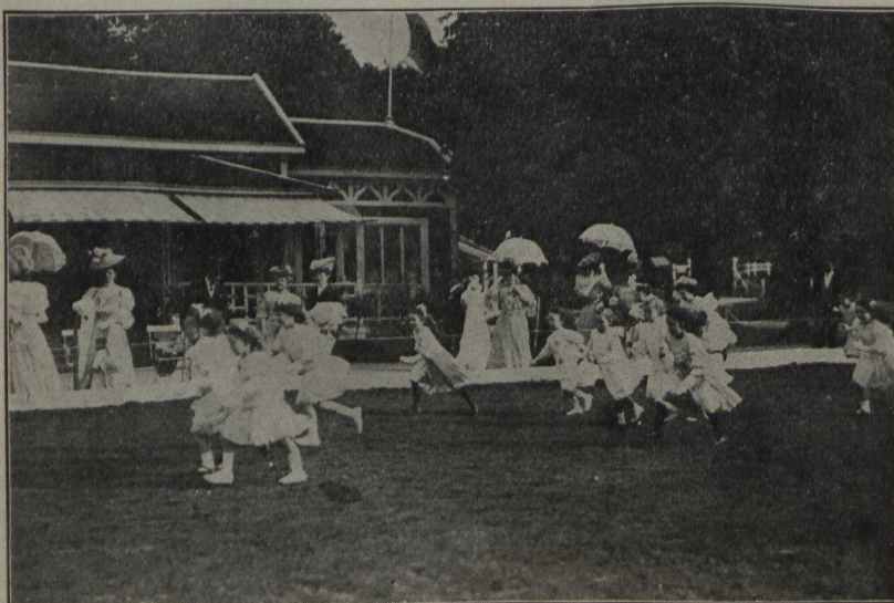
EN FRANCE.—Au festival organisé par la duchesse d'Uzès, au Jardin de Paris : Les Sports pour enfants.