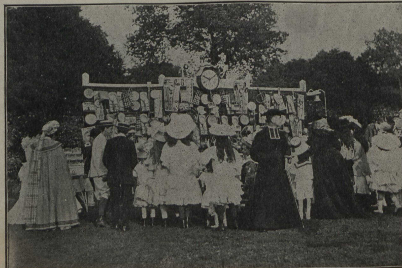
EN FRANCE.—Au festival organisé par la duchesse d'Uzès, au Jardin de Paris. Les prix de la tombola, offerts aux enfants.