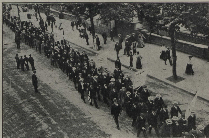
EN ANGLETERRE.—Procession de fidèles, suivant les quais de la Tamise, à Londres, en signe de protestation contre le bill de l'éducation. Fin juin 1906.