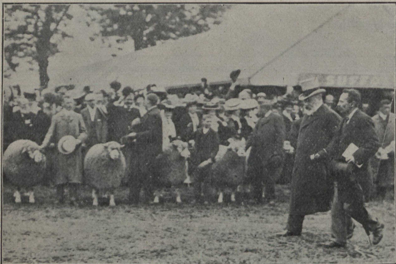
EN ANGLETERRE.—Sa Majesté Edouard VII, visitant la section des produits de l'élevage à la dernière exposition royale d'agriculture.