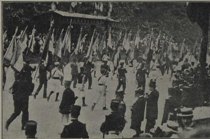
EN FRANCE.—Défilé des sociétés de gymnastique, à l'occasion de la fête nationale du 14 juillet, 1906.