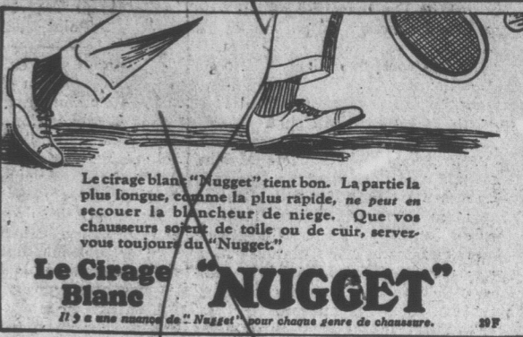
Le Cirage Blanc "NUGGET" est le plus long, comme le plus rapide, ne peut en secouer la blancheur de neige. Que vos chausseurs soient de toile ou de cuir, servez-vous toujours du "NUGGET".

Toujours savoureux et croquant Plein de vigueur printanière. Avec lait ou fruits pour déjeuner