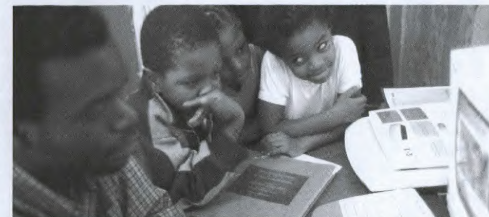
Apprendre par la technologie : un médecin à Lusaka, en Zambie, renseigne des enfants sur le VIH et le sida.

Dans toute l'Afrique australe, mais en particulier dans des pays riches en ressources comme le Mozambique et l'Angola, les gouvernements ont fait des mines et de l'énergie les principales